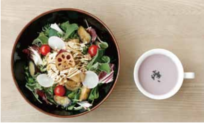
シシリアンライス ————— 860 税込 | シシリアンライス・スープ |

佐賀のご当地メニュー。ごはんの上にいる野菜のサラダと甘辛く炒めた国産豚肉と玉ねぎをのせて。