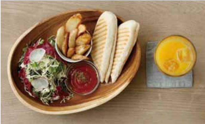
パニーニセット ————— 780 税込 | パニーニ・ポテト・サラダ・ドリンク |