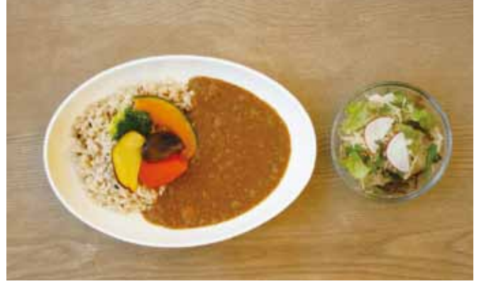
野菜カレー ————— 720 税込 | カレー・サラダ |

佐賀のご当地メニュー。ごはんの上にいる野菜のサラダと甘辛く炒めた国産豚肉と玉ねぎをのせて。