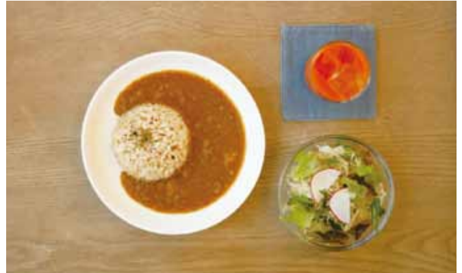
ミニカレーセット ————— 580 税込 | ハーフサイズのカレー・サラダ・ドリンク |